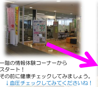
一階の情報体験コーナーからスタート！ その前に健康チェックしてみましょう。 ↓血圧チェックしてみてくださいね！

前回は、天気が悪くても屋内を歩いて運動不足解消できる「にこ♥ふるウォーキング」をおススメしましたが、今回は、もっと「にこ♥ふる」での時間を楽しく過ごすために施設のご案内をしてみたいと思います。(^^)/ (避難者支援副担当の山本と沼澤が体験してみました～♪)