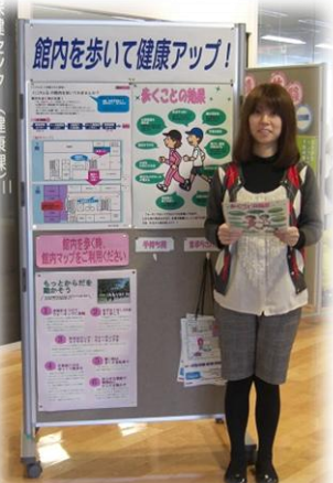
貸し出し用館内マップがあるので、それを持ってウォーキングしてみよう！