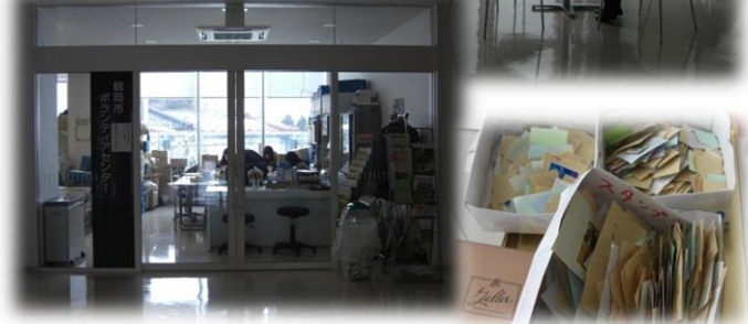
休憩がてら、2階のボランティアセンターで簡単なボランティア作業はいかがですか？切手仕上げなどは曜日に関わらず作業できます！10分でも1時間でもムリのない時間内でご協力ください(^_^)/