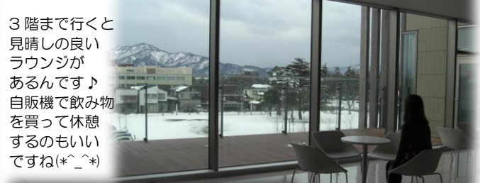
3階まで行くと見晴しの良いラウンジがあるんです♪ 自販機で飲み物を買って休憩するのもいいですね(*^_^*)