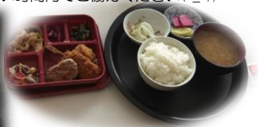
↑日替わり定食ワンコイン 500円！ (A：魚系、B：肉系で選べます！) お昼には、一階入り口にある「軽食喫茶さくら」でお食事はいかがですか？ (営業時間 11:00～15:00)