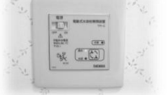
↑ 電動不凍栓 ボタンで簡単に操作できます。