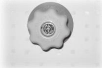
↑ 手動不凍栓 主に台所やトイレの壁にあります。

凍結が予想される夜間や、長期間鶴岡を留守にする時は不凍栓（ふとうせん）を操作して、水道管の水抜きをしましょう。