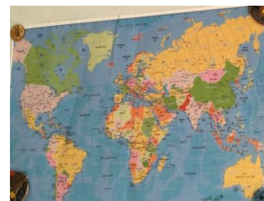
先生が持ってきてくれた世界地図。外国では、日本の位置は極東にあるそうです。

お茶会後は簡単なヨガを教えてもらい、身体もほぐれて心身共にリラックスできました。ヨガのあとは、先生から手相も見てもらいました。昼食はアトリエ・パッションの3種類のパスタを軽食として用意し、みんなで分けて食べました。参加者の方が自家製の漬物を持ってきてくださり、一緒においしく頂きました。食事中も話は尽きず、かわいい参加者さんも来てくれて、ほんわかとした時間を過ごしました。