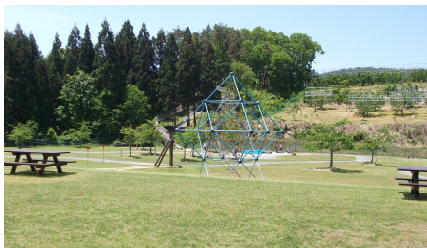
《ワクワクランド》成島町 米沢の大きな公園といえばココ!! 小さな子から遊べる広〜い公園。土日はニ動物園もくるよ