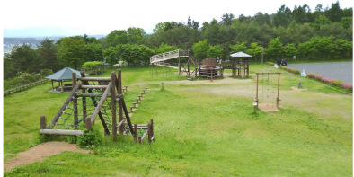
《大森山公園》古志田町 アスレチックもある公園。わんぱくさんに😊

外遊び・散歩が楽しく気持ちのいい季節になりましたね。 米沢には、大きい公園から小さい公園…とたくさんの公園がそれぞれの町にあります。そんな公園をちょっとピックアップしてのご紹介！ お子さんと、お孫さんと、そしてお散歩コースに足を運んでみませんか？