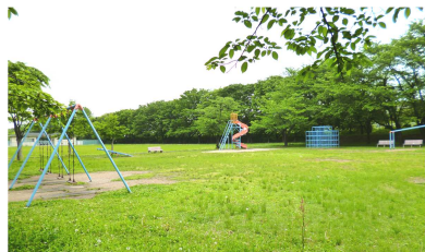
《北村公園》金池 近くに図書館・「おいで」があって便利