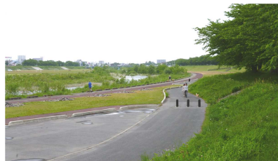
《最上川下流河川緑地》東 最上川の水の音に心安らぐ事間違いなし

米沢に来て、地元の人と話した時… 『何言ってるんだろ???』『聞きづらいなあ…』『怒っているのかな?』 『私も使ってみたい! 話してみたいわあ』 などなど… いろんな方言についての声をお聞きしました。