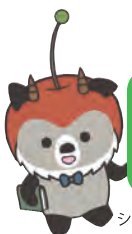
シン 山形県司法書士会 公式キャラクター