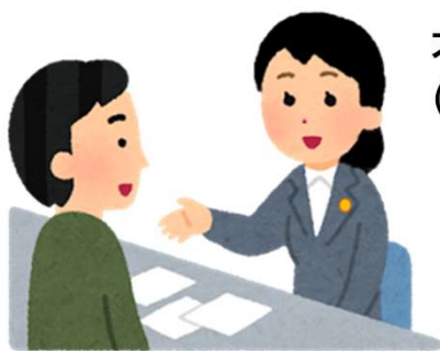
対面(福島事務所へ来所)