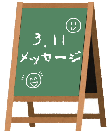
2023年3月11日、東日本大震災から12年を迎えキャンドルナイト「追悼・復興への祈り」が文翔館にて行われました。来場した方からのメッセージをご紹介します。(一部掲載)

山形の皆様 東日本大震災時には一方ならないご支援ありがとうございました。復興にはもう少し時間がかかります。引き続きご支援よろしくお願い致します。 (男性)