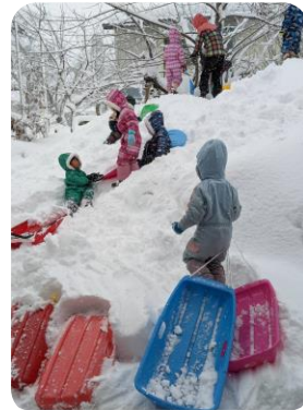
おひさまえん 新しいソリの購入