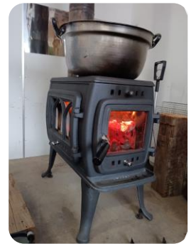
青空保育たけの子 薪ストーブの購入