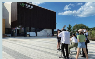
昨年実施した福島浜通りシネマプロジェクトの様子