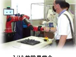
7/12 施設見学会 山形県工業技術センター