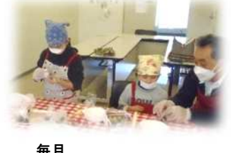
毎月 こどもday! おやつ作り