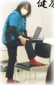
5/31 フットケアを学ぼう