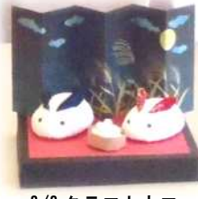
9/9 クラフトカフェ お月見うさぎ