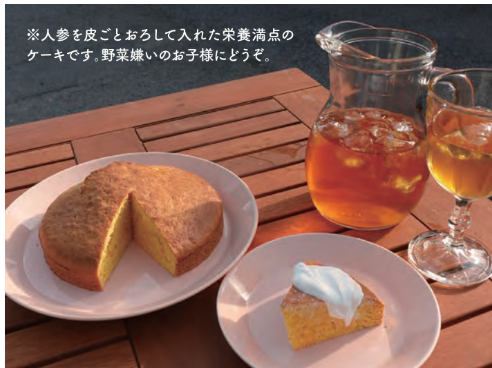
※人参を皮ごとおろして入れた栄養満点のケーキです。野菜嫌いのお子様どうぞ。