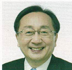
青森県知事 三村申吾