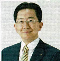
岩手県知事 達増拓也