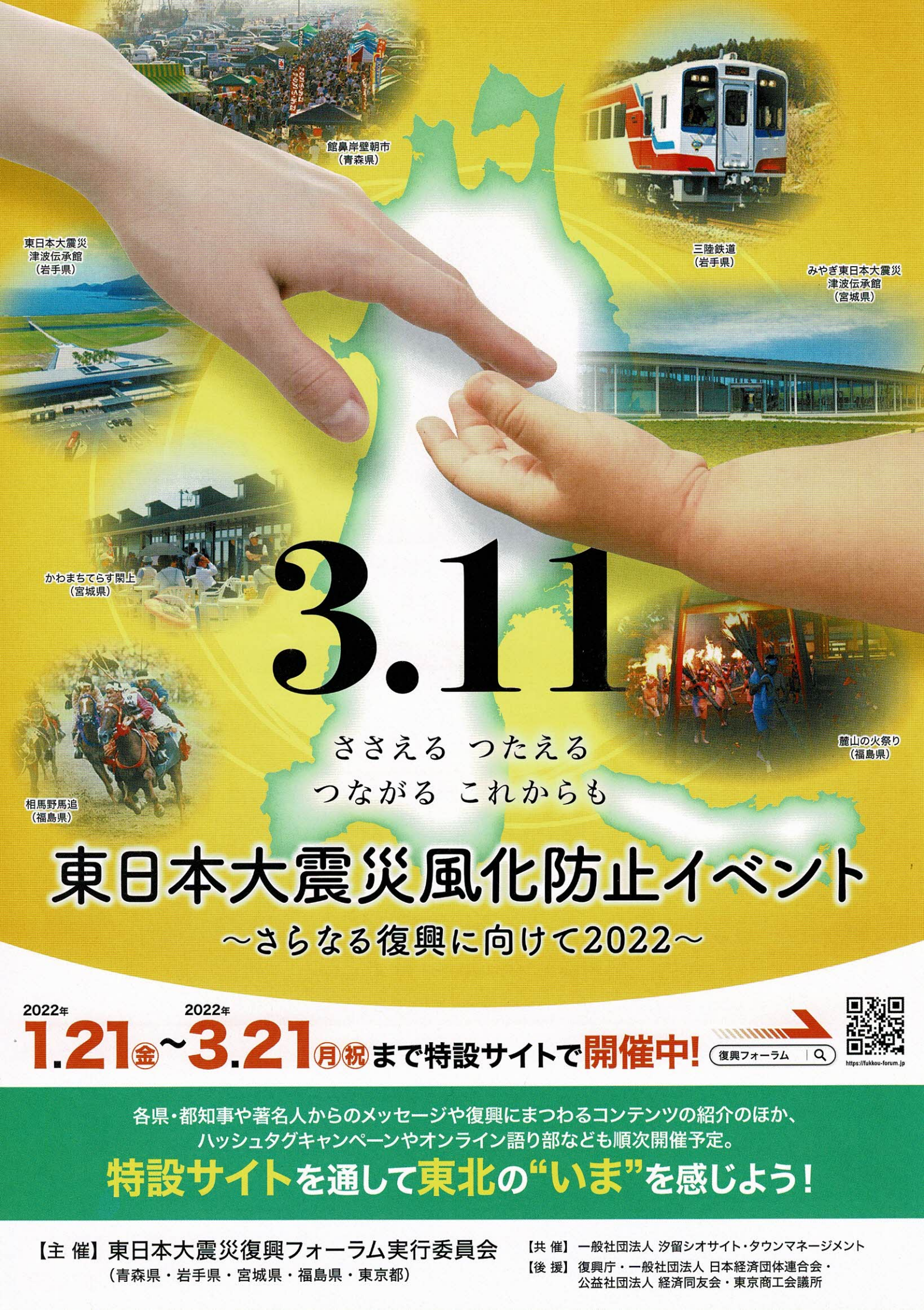
館鼻岸壁朝市 (青森県)