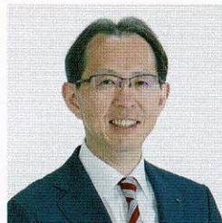
福島県知事 内堀雅雄