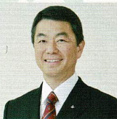
宮城県知事 村井嘉浩